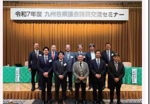
令和7年度九州各県議会議員交流セミナー

これからの沖縄県は、リスクを弱点としてではなく、今後、世界が必要とする技術と社会の在り方を先行して試せる、最大の実験場としての役割が考えられるのではないのでしょうか。