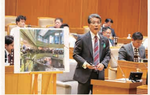
宮古空港整備について

宮古空港利用客は、185万人を突破している。空港での保安検査の効率化、駐機場拡張、平行誘導路などの整備計画について伺う。