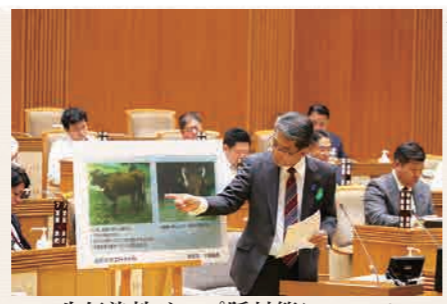
牛伝染性リンパ腫対策について